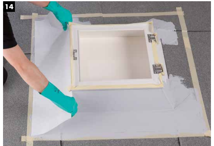
14 Einarbeitung des nächsten Vlieses.