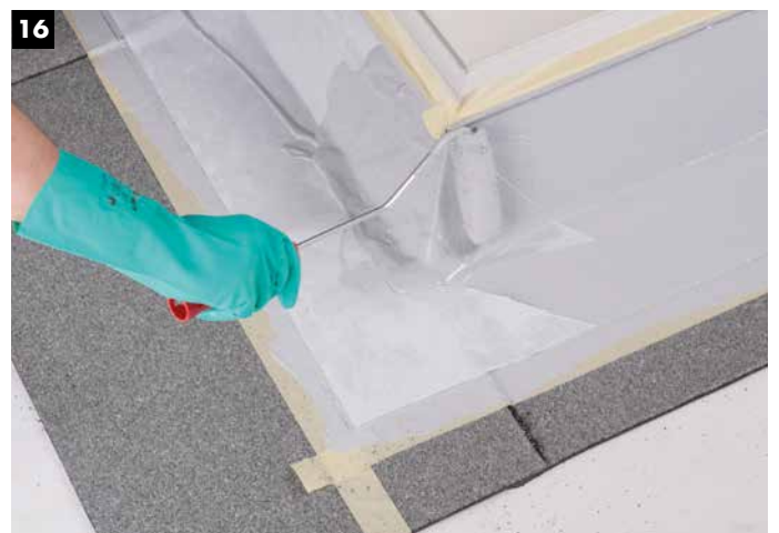
16 Auftrag der Decklage.