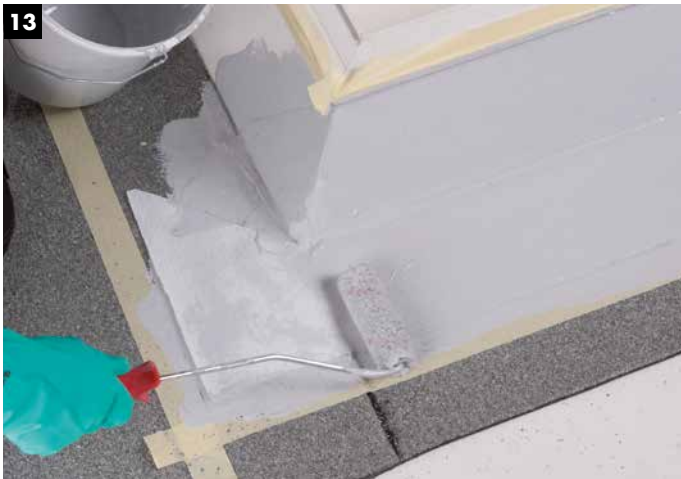
13 Umschlagen der Vliese über Eck und Auftrag der Decklage des Harzes (1 kg/m 2 ).