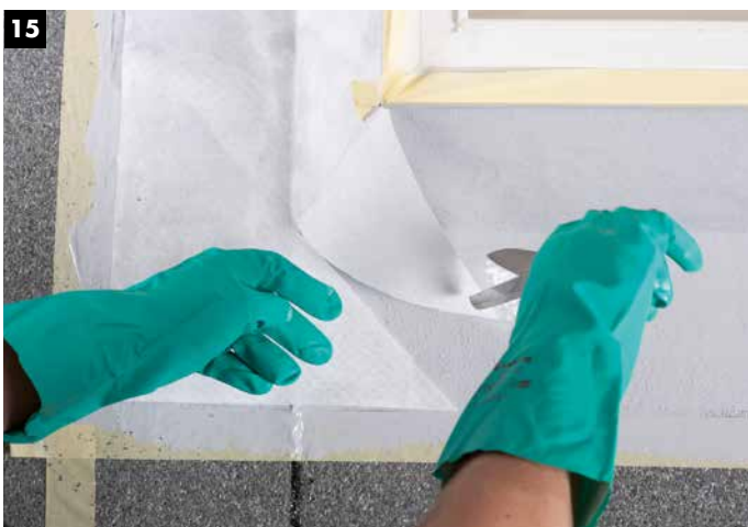
15 Nach Einschnitt werden die Eckbereiche wieder umgeschlagen. (Zu beachten: Auch in den Überlappungsbereichen muss immer Abdichtungsharz vorgelegt werden. Vliesüberlappung mind. 5 cm).