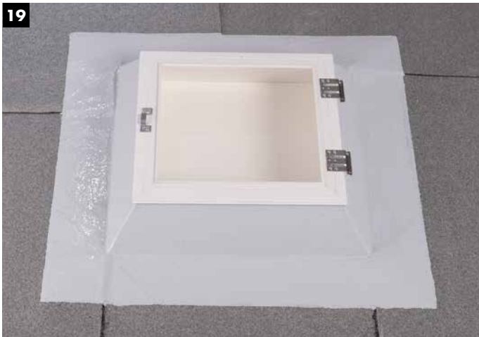
19 Regelkonform und sauber abgedichtete Lichtkuppel.