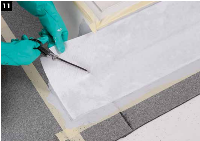
11 Einschnitt in den Eckbereichen.