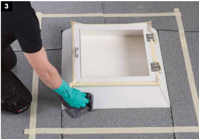
3 Säubern und entfetten der Lichtkuppel mit Aceton-Reiniger. Danach Abluftzeit des Reinigers beachten!