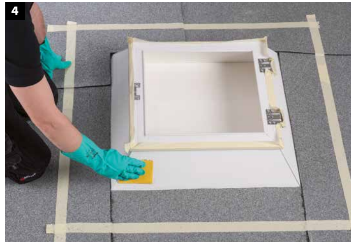
4 Aufrauen der Lichtkuppel (z.B. mit 80er Schleifpapier).