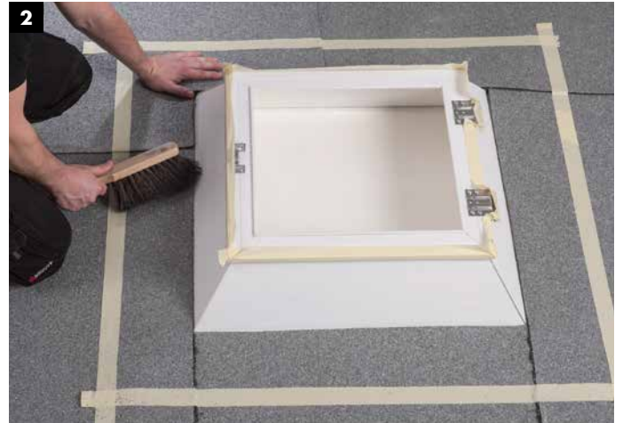
2 Untergrundvorbereitung: Gründliches Säubern der Bitumenbahn.