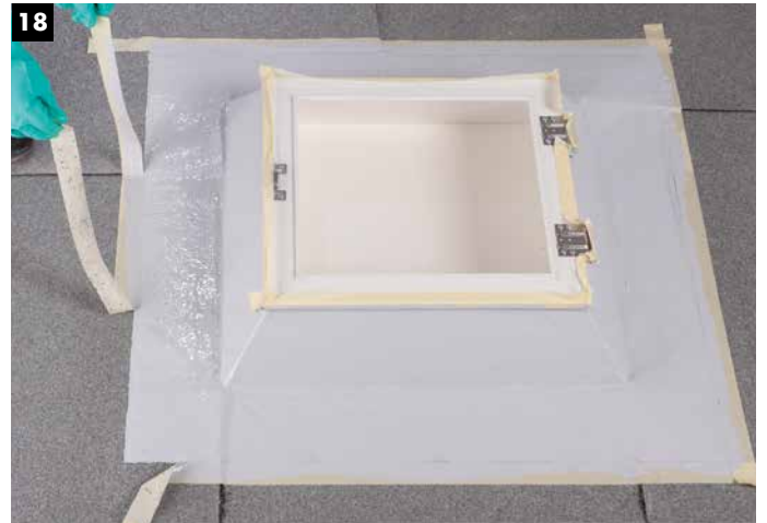
18 Entfernen des Klebebands in frischem Zustand.