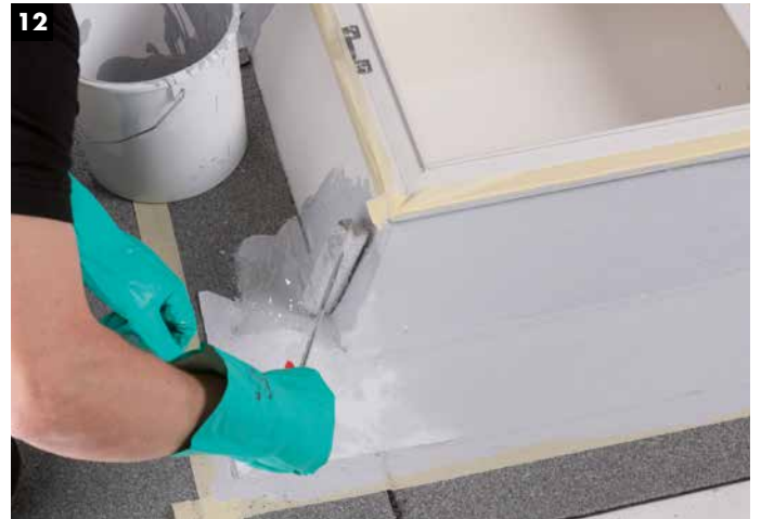
12 Umschlagen der Vliese über Eck und Auftrag der Decklage des Harzes (1 kg/m 2 ).